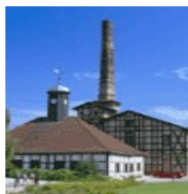
Музей соли в г. Галле

7-й день поездки: Прогулка по парку острова Пайсниц со спортивными играми и аттракционами. Тематические уроки.