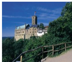
Крепость Вартбург в г. Айзенах

9-й день поездки: Посещение музея шоколада. Прогулки по городу, парку. Спортивные игры и занятия немецким языком.