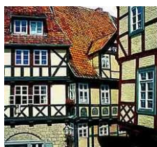
Дома фахверк в г. Кведленбург