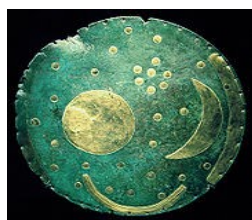
Бронзовый диск из Небры