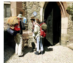
Туристы на тропе Лютера