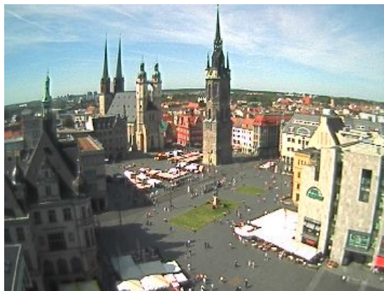
Рыночная площадь г. Галле

Программа имеет общеобразовательную и обучающую направленность. Содержание обучения заключается в обзорных уроках по темам, связанным с посещаемыми достопримечательностями и событиями поездки. Предусмотрено не менее 30 часов занятий. Во время занятий ученики знакомятся с лексикой и выражениями, обиходными фразами и тренируют их применение. Кроме этого, в дороге, на экскурсии, в гостинице сопровождающий преподаватель следит за тем, чтобы с достаточной частотой повторялись фразы и слова, на которые обращается внимание учеников. Программа обучения адаптируется к возрасту учеников, их уровню подготовки, а также пожеланиям учителя и родителей. Как правило, группа состоит из учащихся одного класса, поэтому программа занятий может по желанию учителя состоять в тренировке тех тем и языковых явлений, которые вызывают особые сложности у большинства класса. Объем изучаемого по каждой теме ограничен рамками разумного и возможного, исходя из количества времени и размера группы. Эти же причины в значительной степени определяют и то, что эффект обучения в большой степени зависит от настроения и внимательного отношения каждого ученика. Тем не менее, ожидается как значительный обучающий, так и общеобразовательный эффект, а также прирост социальной компетенции.