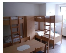
Комната в молодежной гостинице